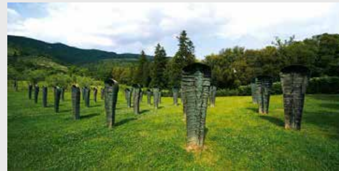
Magdalena Abakanowicz, Katarsis, 1985

La collezione Gori, la cui storia ha inizio negli anni Cinquanta e continua tuttora, è una raccolta privata di arte ambientale che si trova a Santomato in provincia di Pistoia. La collezione vanta oggi un numero straordinario di opere realizzate in spazi interni ed esterni (nel magnifico parco) da artisti provenienti da tutto il mondo che hanno pensato e perfezionato ogni lavoro in relazione allo spazio esistente. Così concepite, sculture, pitture e installazioni diventano parte integrante di un luogo destinato ad assumere una vera e propria identità, nel pieno rispetto della natura, della vegetazione, e in generale dell'ambiente circostante.