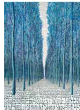
Tobia Ravà, Bosco azzurro, 2013

Tobia Ravà, dopo aver sperimentato molti percorsi creativi inerenti al rapporto arte e scienza, dal 1998 ha avviato una ricerca legata alle correnti mistiche dell'ebraismo: dalla kabbalah al chassidismo, proponendo un nuovo approccio simbolico attraverso le infinite possibilità combinatorie dei numeri. La logica letterale e matematica, che sottende le opere di Ravà, è intesa come codice genetico e raccoglie elementi sia filosofici sia linguistici che vanno a costituire una sorta di magma pittorico fatto di lettere e numeri, che si cristallizzano sulla superficie "grandangolata" di vedute di canali e boschi, di architetture e paesaggi (Maria Luisa Trevisan).