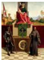
Pala di Castelfranco