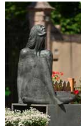
Bruno Lucchi, Contemplazione, 2002

Come sentinelle dello spirito, le sculture di Bruno Lucchi nascono dalla terra e guardano al cielo. Siamo di fronte a forme solide e compatte dotate di anima, di mistero e di infinita bellezza. Conservano e sprigionano una forza primigenia alla quale è difficile resistere: l'istinto è di toccarle, di abbracciarle e anche di ascoltarle nella consapevolezza che al di là dei silenzi enigmatici, c'è un'umanità profonda, antica e presente che attende solo di essere svelata. L'artista trentino, da tempo sulla scena nazionale e internazionale, è noto al pubblico per una vis espressiva essenziale e potente che unisce, in un connubio straordinario, arcaismo e modernità.