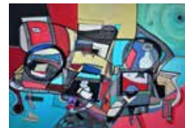
Massimiliana Sonogo, Scherzo 2 - Ingranaggi, 2023

L'intento è quello di abbracciare il tempo e le cose nel loro incessante e proliferante movimento, per scoprirne i segreti e le evoluzioni.