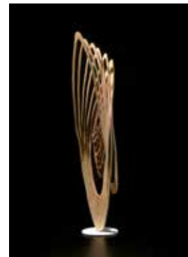
Aldo Pallaro, La luce tra gli anelli II, 2019

Con Pallaro, il legno è infinito: diventa cattedrale gotica, spirale, farfalla, foresta, conchiglia, fiore, geometria, intrigo intellettuale, perfino sesso. Ma restando legno, senza prendere altre sembianze. La tecnica sopraffina, una ricerca certosina che vola molto più in alto dell'arte applicata, fanno entrare in gioco la luce e lo spazio. (...) È il miracolo di Pallaro dare al legno il movimento, un dinamismo che la natura non ha previsto a questo livello. La sua arte è natura indagata, senso della creazione primordiale, voglia di osmosi fisica con la materia, inno ad un'essenza superiore. Le sue sculture sono il talamo in cui legno e uomo mischiamo il loro essere. (Paolo Coltro, 2017)