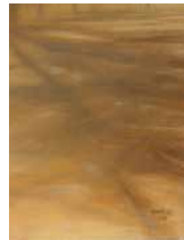
Immagine a fianco: Ombre di alberi, pastello su carta, 2020 (particolare)

Le figure sembrano scomparire sotto i mille rivoli di una luce endogena, la luce del pastello, che modula apparizioni, suggerisce impressioni, pensieri e ricordi.