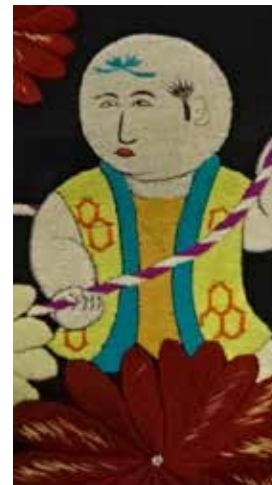
Immagine a fianco:

L'arte giapponese è famosa nel mondo per l'eccellenza dei suoi manufatti; nel settore tessile, in particolare, la specializzazione nelle tecniche di tintura e di tessitura, fa dei kimono degli autentici capolavori d'arte. Per l'occasione, viene presentata una selezione di questi abiti appartenenti ad una collezione privata; il filo conduttore sarà dettato dal tema di stagione: conosceremo fiori e foglie del Giappone e dell'Occidente e, in un dialogo fra culture, scopriremo come e perché questi motivi sono rappresentati sui kimono e il ruolo che hanno avuto nello scambio i "nostri" grandi artisti del primo Novecento.