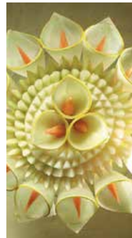
Immagine a fianco: Beppo Tonon, Fiori scolpiti (particolare)

Dalla proiezione di immagini che esibiscono bellissime nature morte fiamminghe su eleganti tavole rinascimentali, lo sguardo passa sulle mani veloci di uno dei più noti scultori degli alimenti: Beppo Tonon. Con inesauribile fantasia e invenzione, come dal cilindro di un mago, nascono creature di polpa e di essenze, di fiori e di foglie. È l'incanto della natura che risplende in ogni tocco e in ogni respiro, che rifiorisce, incredibilmente, dalla punta del coltello, compagno fedele di prestigiose esibizioni.