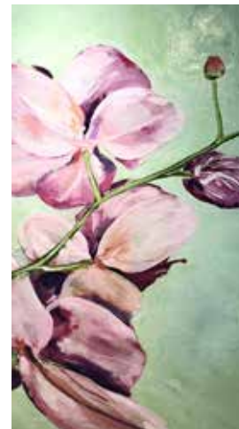
Immagine a fianco: Orchidee, olio su tela, 2021 (particolare)

L'esplorazione della natura, delle piante, dei fiori, in particolare le orchidee, autentiche principesse del regno vegetale, costituisce il leitmotiv dell'indagine pittorica dell'artista. Inizialmente attratto dai dettagli e dall'isolamento di una porzione-cellula di mondo quale una mela, uno stelo, una bottiglia, Missaglia è andato via via elaborando forme più complesse ed estese, nutrite di colori esplosivi e vitali. Le sue orchidee sono un omaggio all'Isola dei Morti, alla crescita spontanea di questo fiore che qui, sulle sponde del Piave, è un richiamo sincero alla storia e alla memoria.