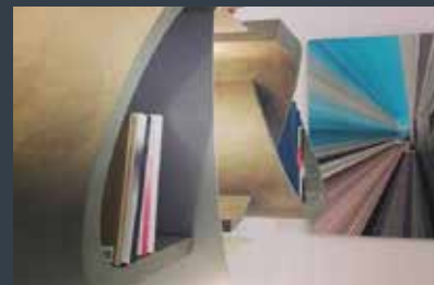
Libreria in mostra alla Galleria Design a Torino